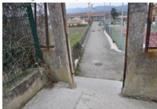
Point critique 15

L'escalier rend impossible l'accès avec une poussette, et est dangereux avec de jeunes enfants