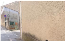
Point critique 9