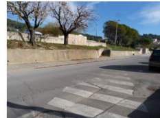
Point critique 10

Mur du stade trop bas, hauteur de chute conséquente